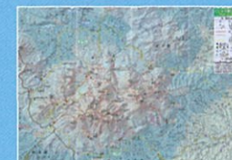
▲長者原ビジターセンターで販売している登山マップ(300円) *裏面は阿蘇くじゅう国立公園マップ

今年度、大分県内で発生した遭難事故19件のうち14件がくじゅう連山で発生しており、くじゅう連山での事故が昨年の2倍のペースで推移しています。これを受けて6月28日に大分県警などの関係機関が集まり、くじゅう連山における遭難対策会議が行われました。現在発生している遭難事故の多くが、国立公園の正規の登山道以外の私設登山道で発生しているようで、中でも南側での事故が多発しているようです。長者原ビジターセンターやくじゅう地域の売店等では、国立公園の正規の登山道を中心に掲載した最新の登山地図を販売しておりますので、登山の際はぜひこちらをご利用ください。また、くじゅうファンクラブホームページでも、国立公園の路線を中心に掲載した登山地図をご覧いただけます。 くじゅうファンクラブでは、長者原ビジターセンターにて収集した、くじゅう連山における各種登山道の情報を、随時登山道の管理者や関係機関に提供し、登山道の維持管理及び遭難対策事業に役立ててもらっています。くじゅう連山の登山道の危険箇所等の情報があれば、ぜひ長者原ビジターセンターまでお寄せください。