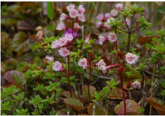
5/31 坊原のイワカガミ