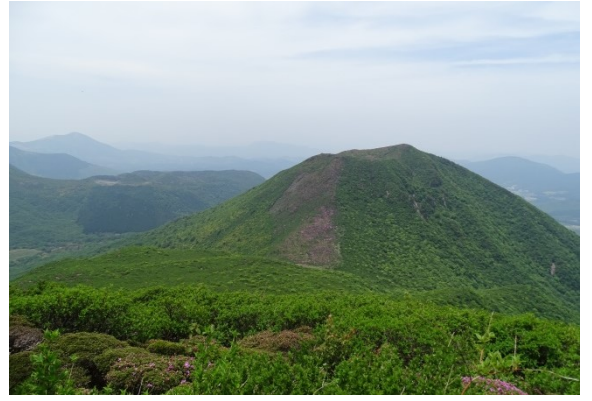
5/30 北大船から平治岳